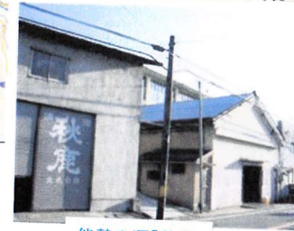
能勢の酒「秋鹿」 秋鹿酒造((有))