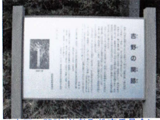
吉野の關跡